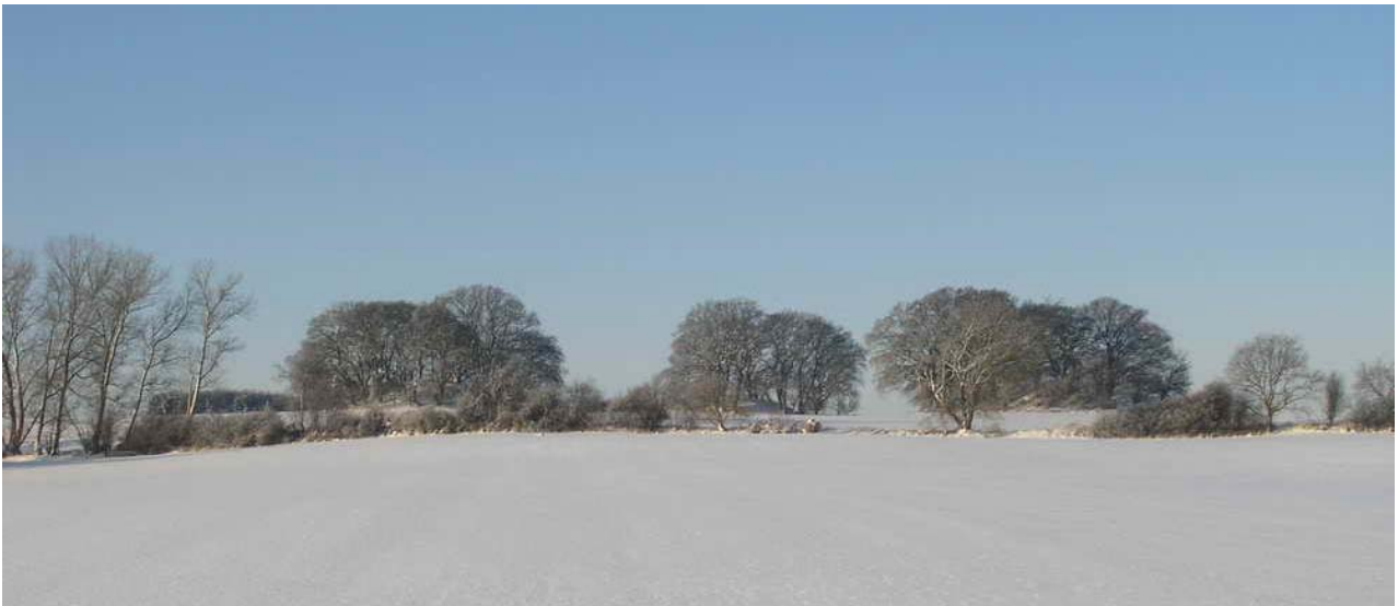
"De tre Søstre" som de ses en vinterdag fra vejen mellem Gevninge og Lejre.